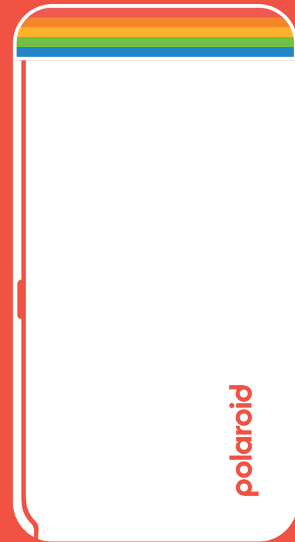
2"x3" Pocket Photo Printer Quick Start Guide

A Photo Eject Slot Fente d'éjection des photos Ranura de expulsión de fotos Vano per espulsione foto Fotoauswurfschlitzz 写真イジェクトスロット 照片弹出槽 용지 배출구