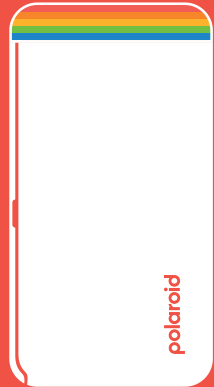
2x3 Pocket Photo Printer Quick Start Guide

A Photo Eject Slot Fente d'éjection des photos Ranura de expulsión de fotos Vano per espulsione foto Fotoauswurfschlitz 写真イジェクトスロット 照片弹出槽 용지 배출구